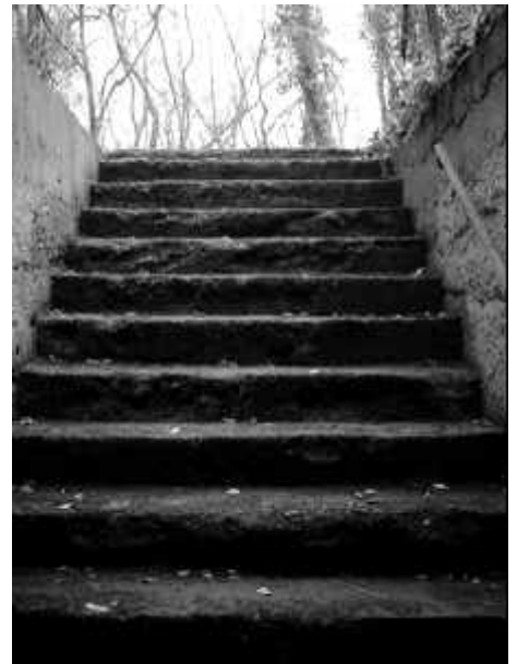
Und dann ging es auf und ab.