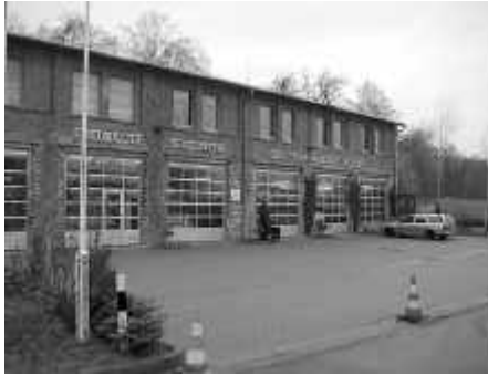
Erste Station: Natürlich die Feuerwehr.

Eine Idee wurde Wirklichkeit: Schon lange gab es die Idee, sich während der Seminare Presse- und Öffentlichkeitsarbeit auch einmal dem Thema Journalistische Fotografie zu widmen. Und so geschah es. Erste Ergebnisse zeigen die Bilder auf dieser Doppelseite.