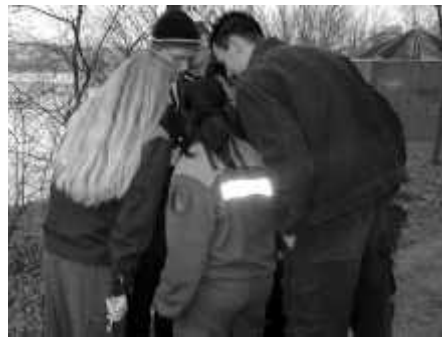
Teamwork: Was soll denn nun aufs Foto?