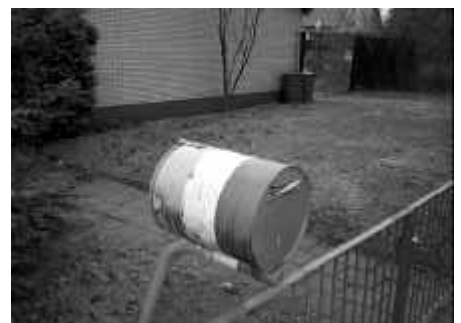
So einige wundersame Dinge wurden gefunden und im Bild festgehalten.