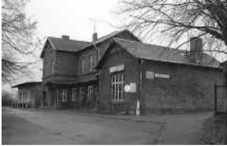
Der Bahnhof von Malchow - mal von weitem fotografiert, mal ganz nah gesehen.