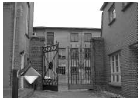
Manche Tore öffneten sich.