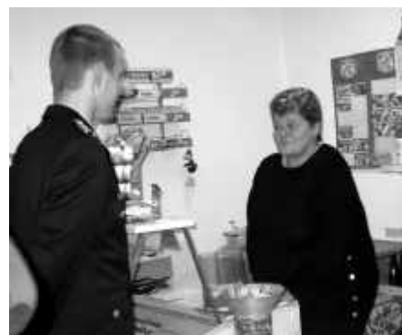
Die Frau, die die JF noch nicht kannte.*