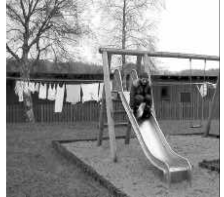
Auf einen Rutsch nach Malchow.*