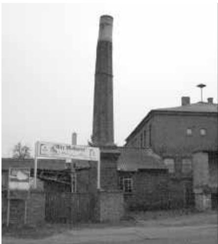
Der schiefe Turm von Malchow.

Natürlich gehört auch die Bildunterschrift zu einem journalistischen Foto. Die mit einem * gekennzeichneten Texte entstanden im Seminar.