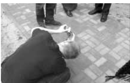
Und manchmal lohnt sich einfach auch ein Perspektivwechsel.