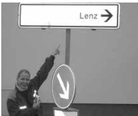
Die neue LJW, super ausgeschildert.*