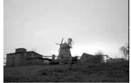
Abendstimmung mit Mühle...