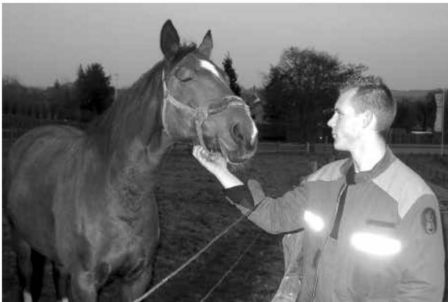
Wie wär's, Du und ich, wir Beide?*