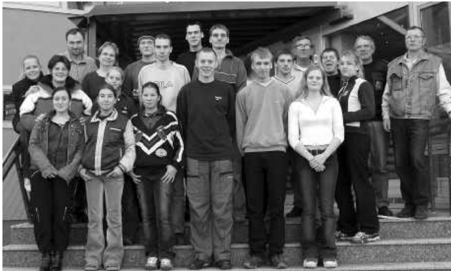
Die Geburtstagsgäste: Seminar Presse- und Öffentlichkeitsarbeit in Malchow im Herbst 2003

Wie hatte es eigentlich angefangen? Es war an einem dunklen Novemberabend des Jahres 2000, als an der damaligen Landesfeuerwehrschule in Malchow eine Gruppe medieninteressierter Enthusiasten, anfangs noch mit Schere und Klebstoff, die „ RauchZeichen “ aus der Taufe hob. Längst haben sich die „RauchZeichen“ - für diesen Namen hatten sich übrigens die Jugendlichen selbst entschieden - zu einer modernen und informativen Jugendfeuerwehrzeitschrift