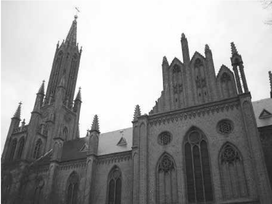
Die Perle der Stadt - Das Kloster