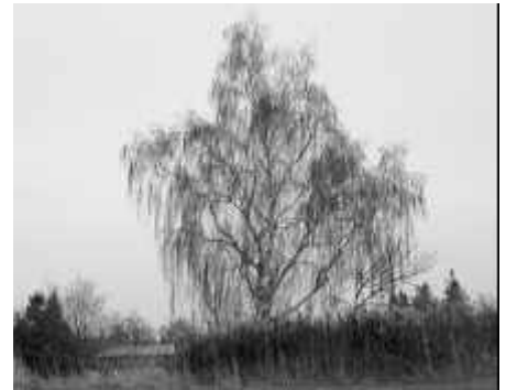
... und mit Birke.