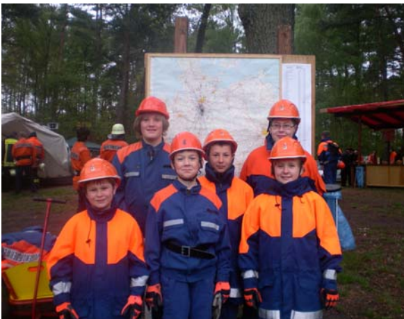
Die Jugendlichen bewiesen unter anderem ihr Wissen in der Geographie.

Feuerwehrfachwissenabverlangt wurden, hatte der Marsch ein Ende. Leider viel zu schnell.