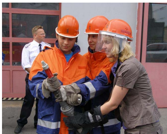
Sozialministerin Schwesig übt sich im Feuerwehrmann-Dasein.