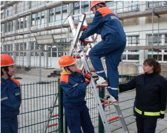
Die Jugendlichen üben sich in der FwDV10: Leitern.

einen Dummie und zehn Osterhasen dargestellt, die es zu suchen galt.