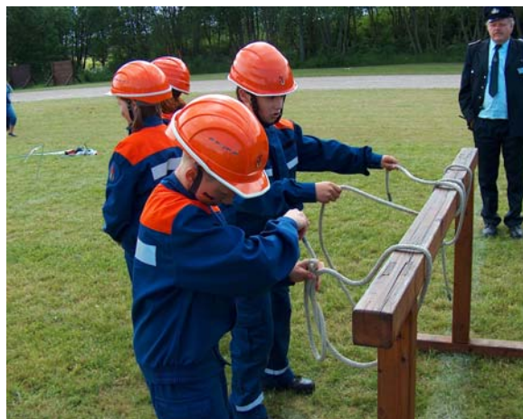
Früh übt sich – auch die „Kleinen“ müssen mit den Knoten zurechtkommen.

Noch vor wenigen Monaten gab es die meisten Kinderfeuerwehren noch nicht, erst durch die Änderungen im Brandschutzgesetz M-V wurde die Aufnahme der 6-jährigen möglich. Die Feuerwehren im Landkreis waren Vorreiter bei den Miniwehren. Jetzt