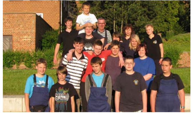
Die Teilnehmer des Landesjugendforums hatten nicht nur viel Arbeit, sondern auch viel Spaß.

Das nun folgende Projekt wurde mit viel Eifer und Kreativität angegangen und man