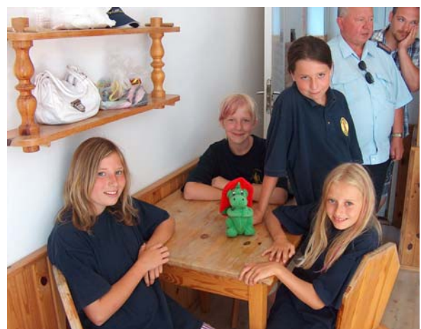
Egal, wohin es geht – Grisu ist mit dabei.