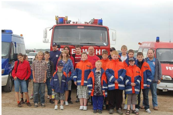
Die Jugendlichen der Jugendfeuerwehr und des THW heben gemeinsam ab.

und Gerätschaften des deutschen und ausländischen Militärs begeistern, sondern auch Einblicke – und Eintritt – in den neuen Airbus A380 nehmen und Beobachter zahlreicher Flug- und Stuntshows werden.