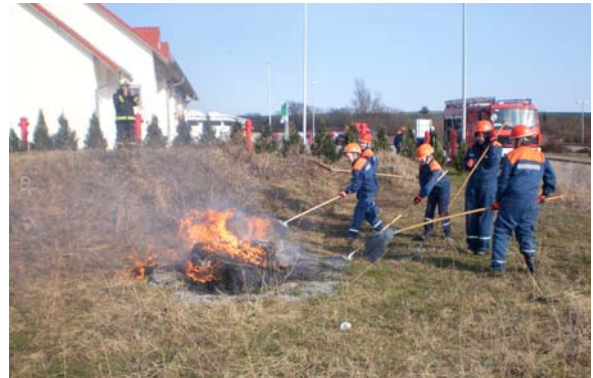
Die jungen Brandbekämpfer üben an einem Flächenbrand.

Der erste Einsatz galt der Bekämpfung eines Flächenbrandes, danach konnten sich die jungen Helfer beim Mittagessen stärken. Denn schon nach dem Aufräumen und dem Abwasch folgte die Praktische Ausbildung an der Schule.